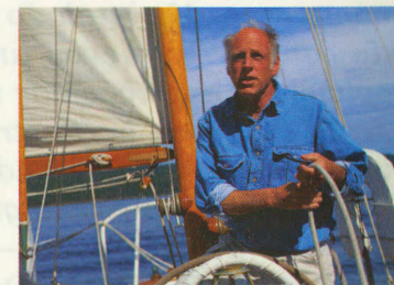
ENTRENAMIENTO EN LAS HABILIDADES DE LA VIDA INDEPENDIENTE

El entrenamiento de REACH sobre las habilidades de la vida independiente me ayudó lograr mi sueño.