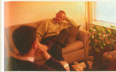
LA INFORMACIÓN Y REFERENCIAS

REACH me ayudó a encontrar los recursos que necesitaba.