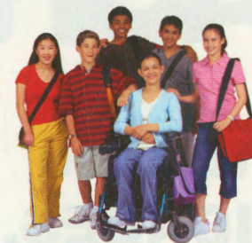
ACONSEJO DEL PAR

REACH me ayudó a conocer a gente con inhabilidades que entienden y ofrecen la ayuda.